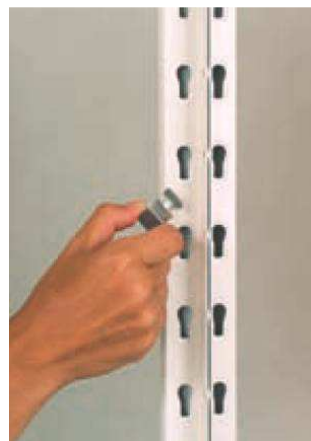
A köztes polcokat 4 polctartó kapocsra vagy hossztartóra helyezze!